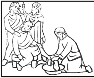
Jesus wäscht seinen Jüngern die Füße