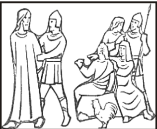
Jesus wird von Petrus verleugnet