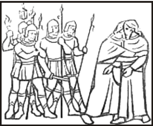
Jesus wird gefangengenommen