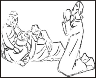
Jesus betet im Garten Gethsemane